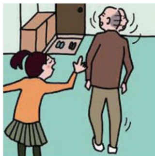
目を離せない家族の見守りなどのケアをしている