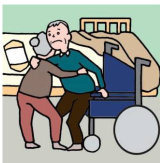
健康不安を抱えながら高齢者が高齢者をケアしている