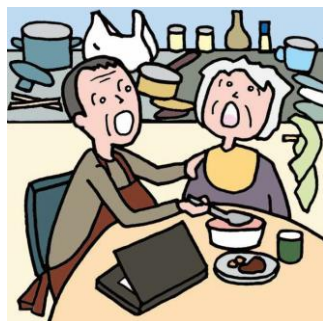
仕事を辞めてひとりで親の介護をしている