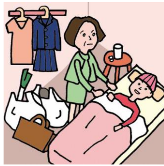
仕事と介護でせいっぱいでほかに何もできない