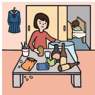
アルコール・薬物・ギャンブル問題を抱える家族に対応している

© 一般社団法人日本ケアラー連盟 / illustration : Izumi Shiga